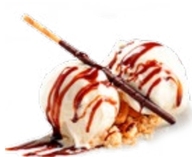
Vainilla de Madagascar

Helados elaborados artesanalmente con productos de temporada sin ningún colorante ni aditivo ni aromas artificiales.