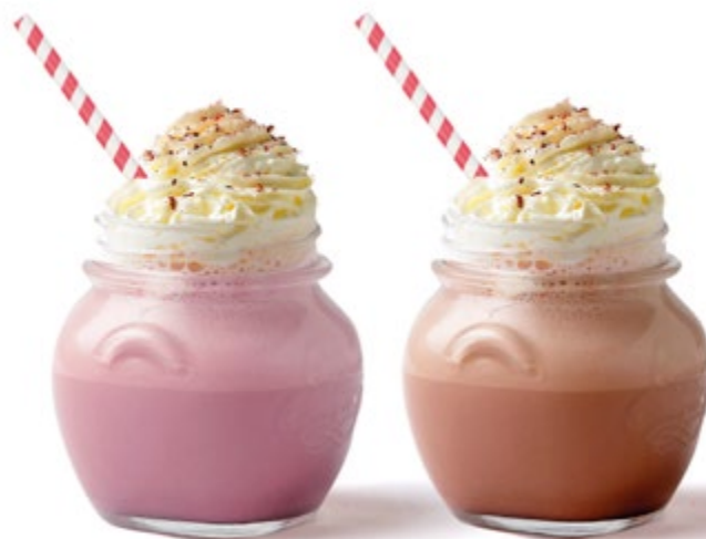
Fresa y Chocolate blanco

Batidos elaborados de forma artesanal. Los sabores de nuestros helados, ahora también disponibles en batido.